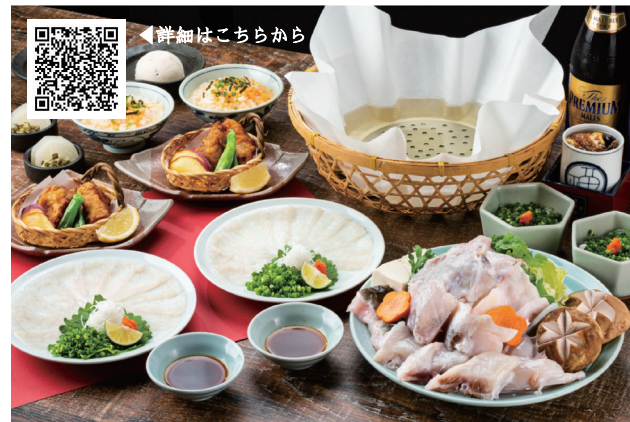
冬季限定の飲み放題付コース「冬安居(とうあんご)」

(注) 当社は自己株式302,067株(所有割合2.17%)を保有しておりますが、上記大株主様の状況には含めておりません。