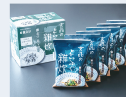
フリーズドライとらふぐ雑炊

これまで以上にワクワク感、期待感を抱いていただける商材創出とリリースサイクルの短縮化を図りつつ、同時に業務効率化、コストダウンも行うことで引き続き高収益体質への改善を一層進めてまいります。