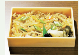
焼きふぐとポン酢の味ごはん