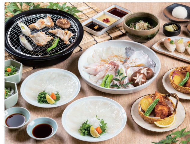
季節限定の焼きふぐコース「夏安居(げあんご)」

(注)当社は自己株式302,067株(所有割合2.17%)を保有しておりますが、上記大株主様の状況には含めておりません。