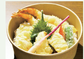
豪華とらふぐ&えび天丼

引き続き、初めてふぐを体験される方や若年層へのアプローチツールとして、新商品の開発・投入を進めてまいります。