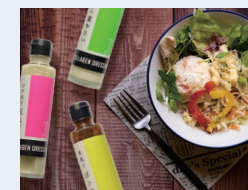
カラーゲンドレッシングシリーズ