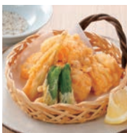
ハモと野菜の金ぶら