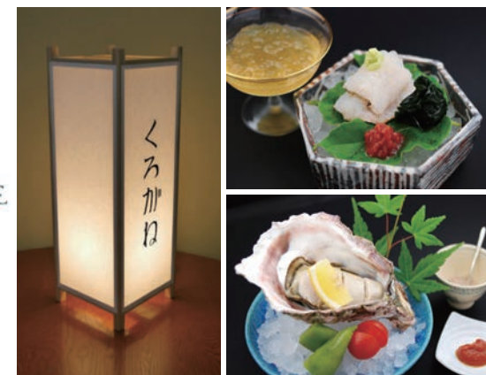
玄銀(くろがね) お料理一例

住所 大阪府大阪市北区曽根崎新地1-3-9 GOTS北新地ビル1号館B1F 電話番号 06-4797-8629