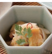
ハモカピタン漬け