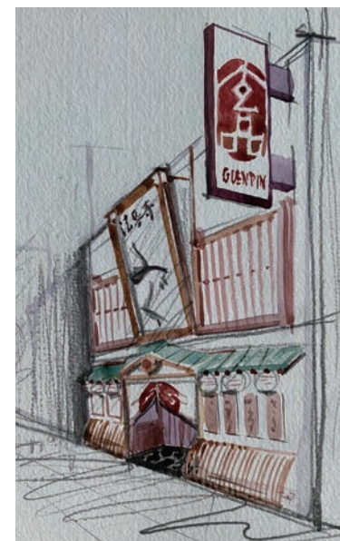
玄品 法善寺 イメージ

住所 大阪府大阪市中央区宗右衛門町5-26 宗右衛門町第一ビル 電話番号 06-6211-3529